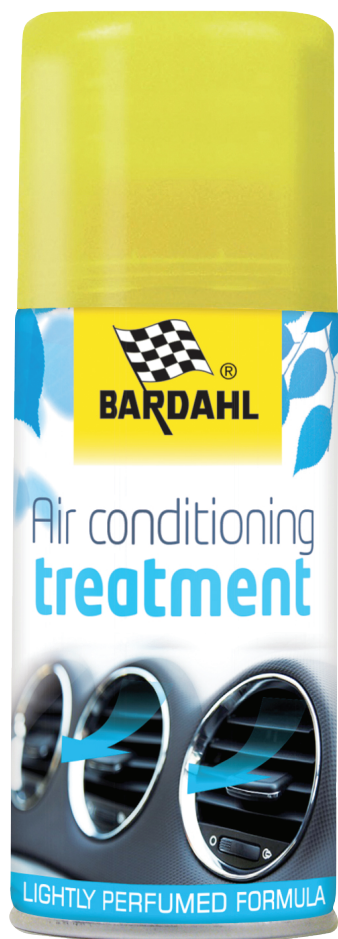
арт. 3164 аэрозоль 125ml